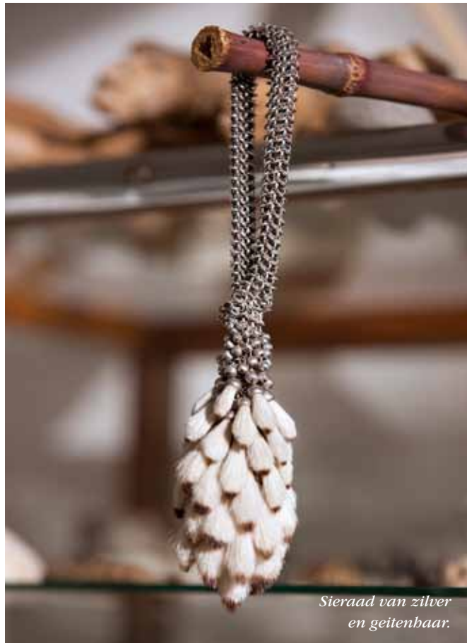
Sieraad van zilver en geitenbaar.