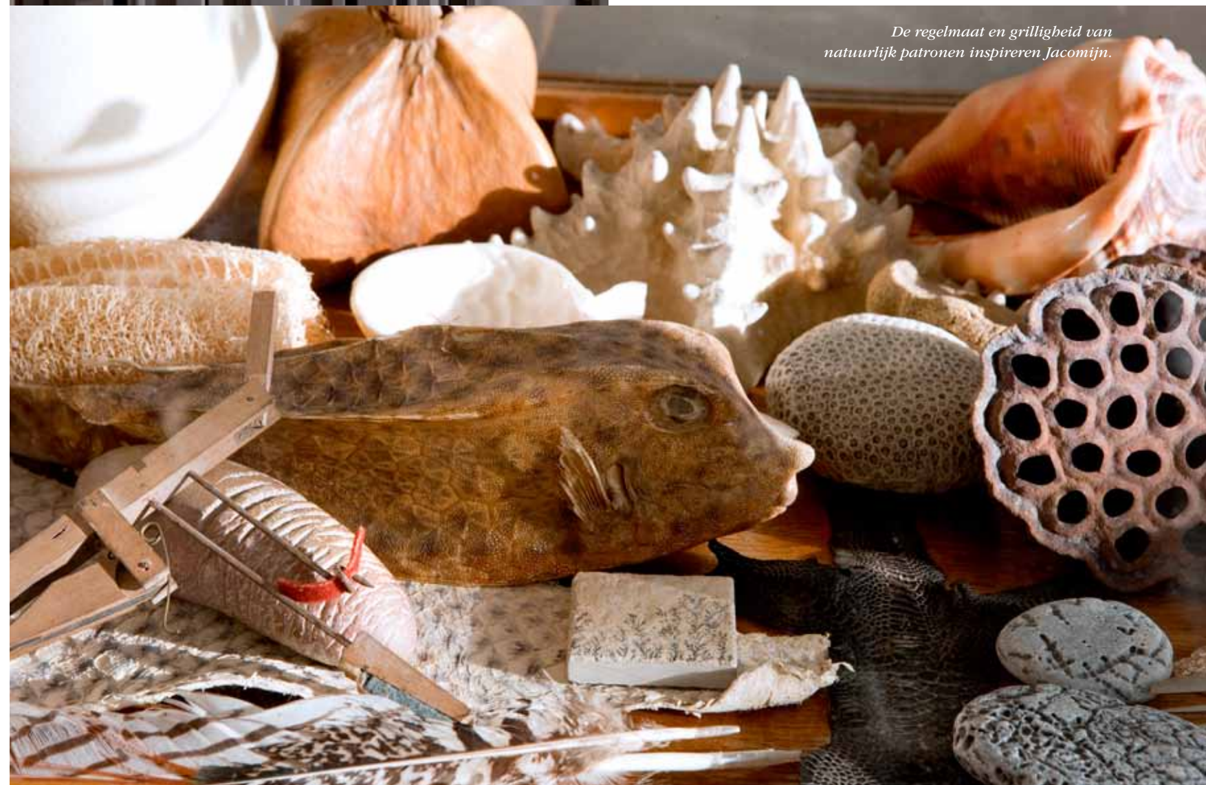
De regelmaat en grilligheid van natuurlijke patronen inspireren Jacomijn.