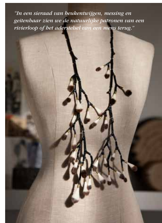
"In een sieraad van beukentwijgen, messing en geitenhaar zien we de natuurlijke patronen van een rivierloop of het aderstelsel van een mens terug."