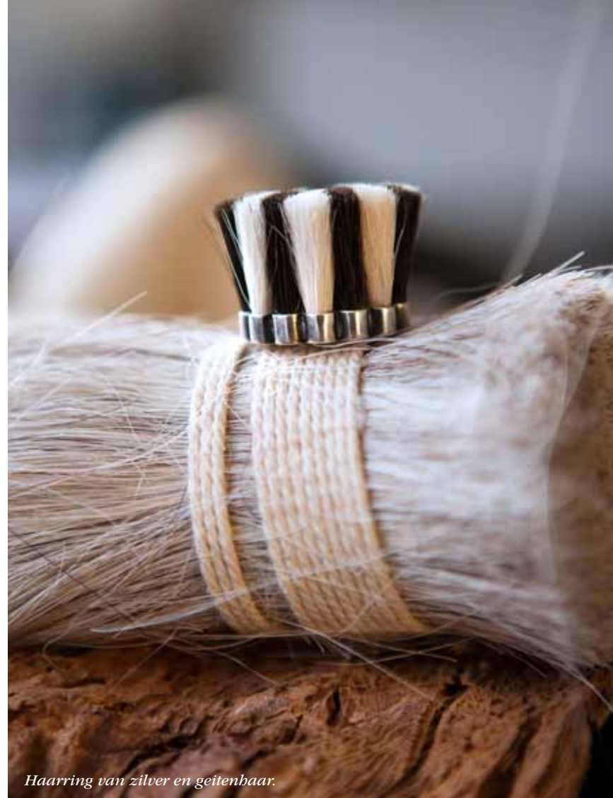
Haarring van zilver en geitenbaar.